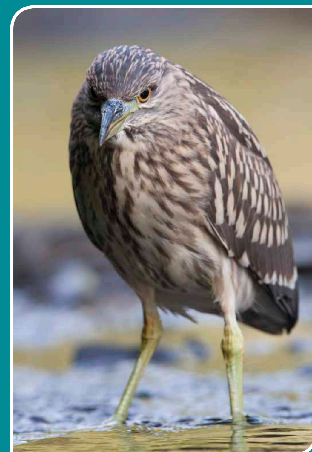
MŁODY, ALE JUŻ SAMODZIELNY ŚLEPOWRON