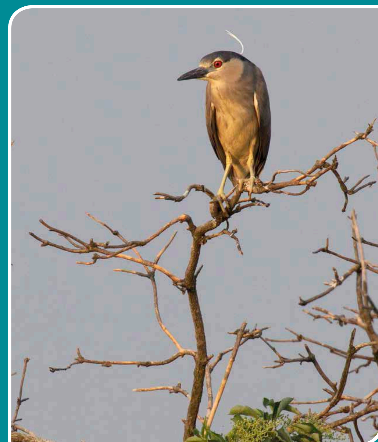
UPIERZENIE ZDRADZA, ŻE TEN ŚLEPOWRON NIE UKOŃCZYŁ 5 LAT

Po opuszczeniu gniazd przez młode osobniki, rodziny ślepowronów rozpraszają się i można je spotkać wzdłuż dolin rzek oraz nad stawami. Ptaki te przylatują do nas w kwietniu, a odlatują we wrześniu i październiku, połowę roku spędzając w tropikalnej Afryce.