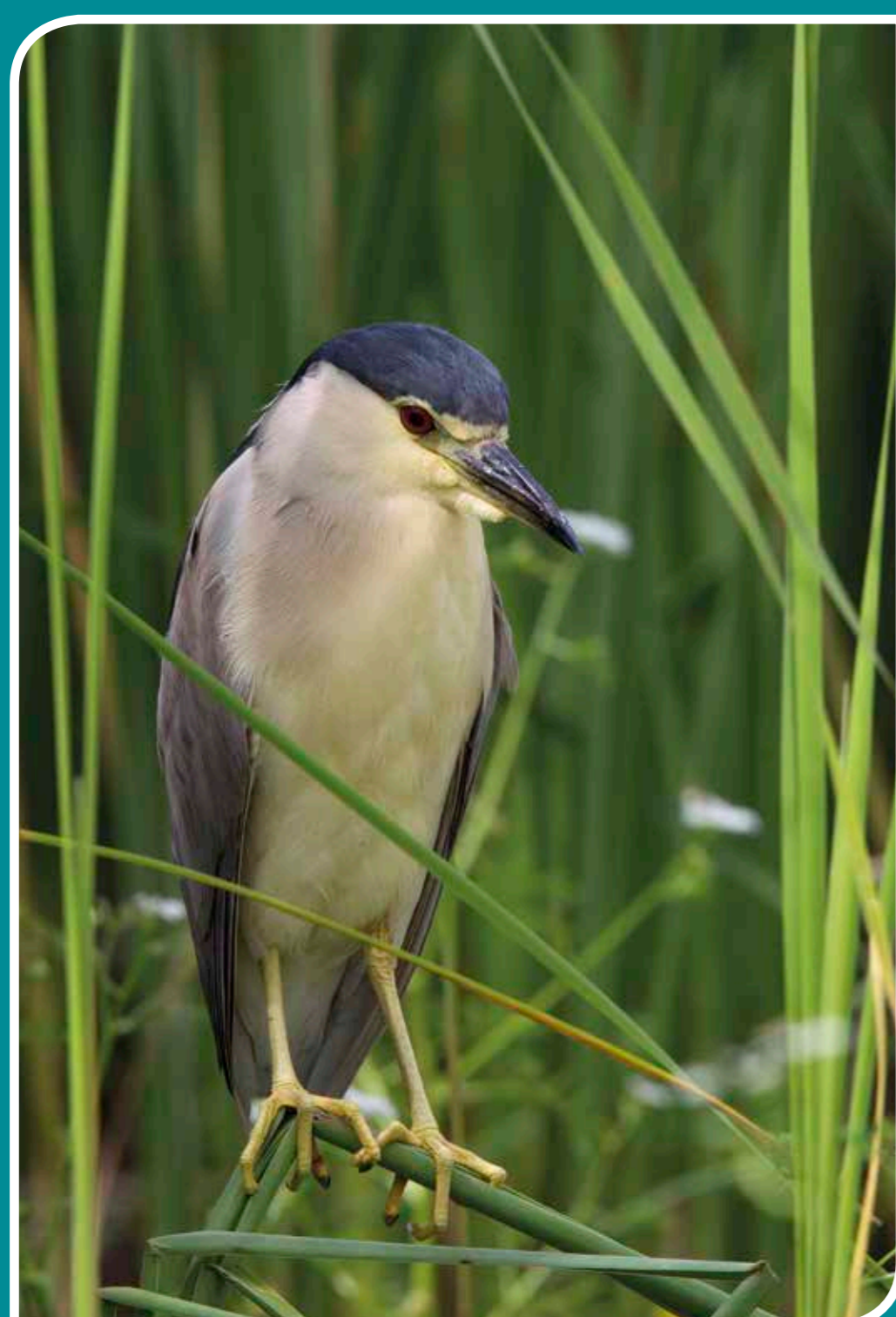
SZUWAROWY MYŚLIWY NA CZATACH