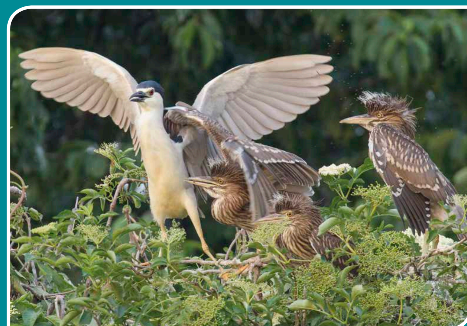
RODZIC KOŃCZĄCY WIZYTĘ U MŁODYCH

Opracowanie: Marcin Karetta, Żaneta Kucharczyk-Chudy