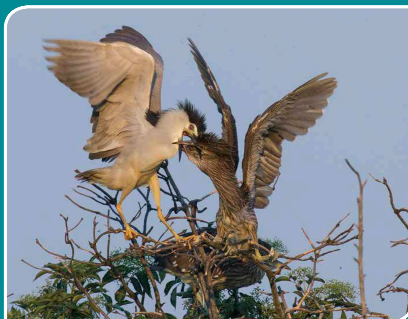
KARMIENIE, CZYLI Z DZIOPA DO DZIOPA